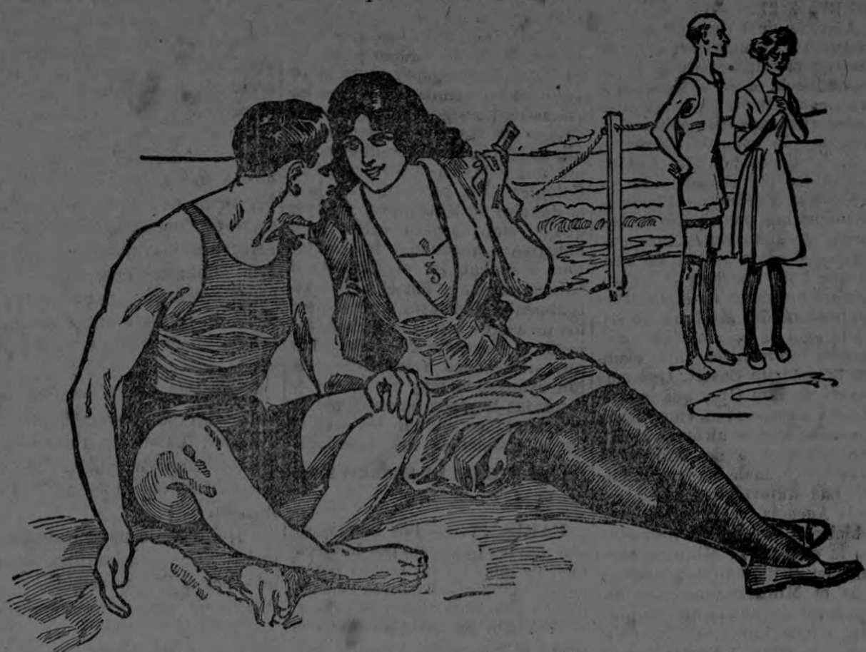
Fíjate en aquel par de raquítics. ¿Por qué no tomarán Sargol para engordar?