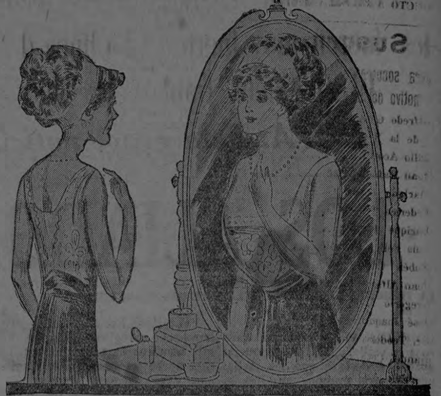
El espejo no miente; tome usted Sargol y pronto notará la diferencia.

Uno de los efectos mas asombrosos del Sargol es la rapidez con que redondea y hace mas pronunciadas las formas divinas de la mujer; y no desarrolla una parte del cuerpo en mayor proporción que las otras, sino todas por igual, en completa armonía. Los cachetes se llenan hasta adquirir su forma ovalada; el cuello y el busto se ponen firmes y duros; los brazos se redondean y adquieren proporciones simétricas y las demás partes del cuerpo femenino se desarrollan en proporción y adquieren esas líneas curvas que los hombres tanto admiran y en las cuales no existe la verdadera hermosura. No hay crema, masaje ni ningún medio artificial para producir carnes y belleza que pueda compararse con el desarrollo perfecto que se obtiene cuando los órganos de digestión y asimilación trabajan en perfecto acuerdo. Ya entonces no hay necesidad de ocultar o tratar de disimular con rellenos y almohadillas, mangas largas y cuellos altos, las imperfecciones del cuerpo femenino. Tome Sargol por algunas semanas, aumente de 5 a 10 kilos de carnes y usted misma se quedará asombrada del cambio tan notable y no solamente adquirirá una bonita figura, sino que su estado general de salud mejorará, su digestión será perfecta y se sentirá usted contenta y feliz y satisfecha de la vida.